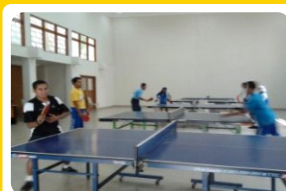
Hall Tennis Meja