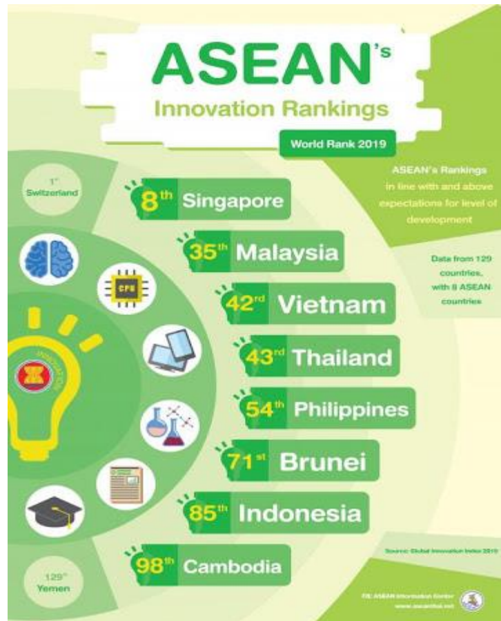
Gambar 2. Global Innovation Index (GII) 2020 di ASEAN, Sumber: Global Innovation Index 2020

bangsa melalui inovasi dalam pengembangan ilmu pengetahuan dan teknologi. Sebagaimana diungkapkan dalam Global Innovation Index 2020 yang dikeluarkan oleh Cornell SC Johnson College of Business, INSEAD dan WIPO sebagai berikut ini: