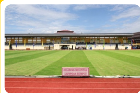
Stadion Atletik dan Sepakbola