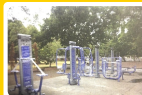
Taman Olahraga Masyarakat