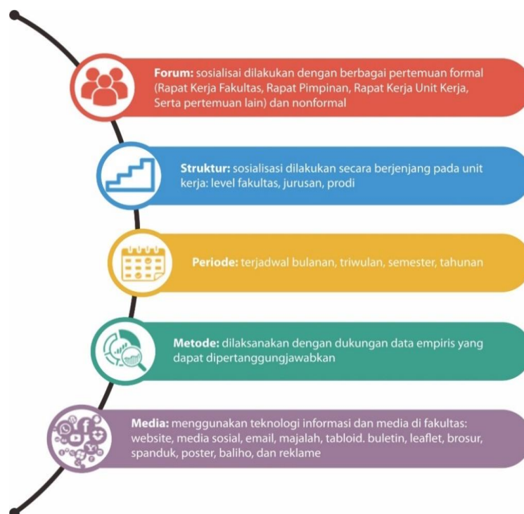
Gambar 3. Kerangka Sosialisasi Renstra FIK UNY2020-2025

Penyebarluasan informasi tentang segala hal terkait Renstra FIK UNY 2020- 2025 secara sistematis, sistematis dan berkelanjutan perlu dilakukan oleh pimpinan FIK UNY kepada seluruh sivitas akademika FIK UNY. Upaya ini harus dilaksanakan sebagai langkah awal untuk mewujudkan keberhasilan implementasi Renstra FIK UNY 2020-2025. Keberhasilan pencapaian target dalam Renstra FIK UNY 2020-2025 bergantung pada komitmen dan kesadaran sivitas akademika FIK UNY dalam pengimplementasiannya, yang dimotori oleh komitmen pimpinan pada semua jenjang. Guna menumbuhkan komitmen tersebut, sivitas akademika perlu memiliki pemahaman yang komprehensif tentang pentingnya Renstra FIK UNY 2020-2025, serta pemahaman peran dan tanggung jawab untuk mengambil bagian dalam melaksanakan segenap program dalam Renstra. Untuk itu, penyebarluasan informasi Renstra melalui sosialisasi harus dilakukan, sehingga setiap perubahan yang terjadi serta langkah yang akan ditempuh diketahui oleh seluruh sivitas akademika FIK UNY. Kerangka implementasi sosialisasi Renstra FIK UNY 2020-2025 disajikan pada Gambar 3.