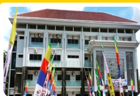
Health and Sport Center