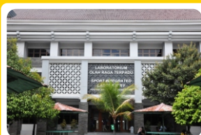
Laboratorium Olahraga Terpadu