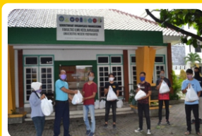
Sekretariat Organisasi Mahasiswa