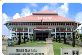
Gedung Olahraga (GOR)