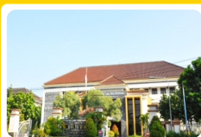
Gedung Pusat Layanan Akademik