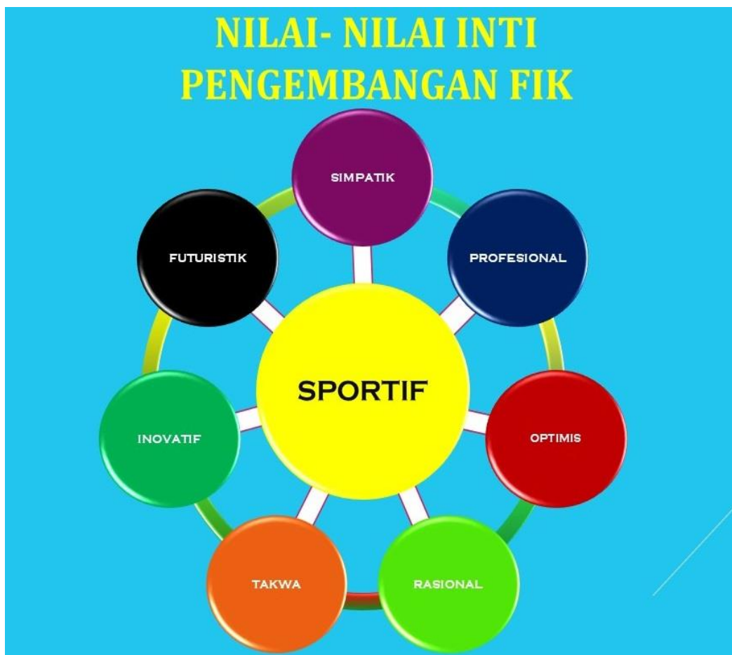
Gambar 1. Nilai-nilai inti pengembangan

Nilai-nilai inti SPORTIF menjadi semangat dan dasar sivitas akademika Fakultas Ilmu Keolahragaan Universitas Negeri Yogyakarta dalam melaksanakan pendidikan, penelitian, dan pengabdian pada masyarakat untuk diarahkan pada pengembangan manusia seutuhnya, serta meningkatkan kualitas kehidupan masyarakat Indonesia. Tuntutan kebaruan, kemajuan, dan kontribusi FIK UNY dalam berbagai aspek di masyarakat harus dilandasi nilai-nilai spiritual, emosional, rasional, dan kultural dalam rangka mensukseskan pembangunan dan pengembangan bangsa Indonesia. Oleh karena itu, semua karakteristik tersebut hendaknya tercermin pada kepribadian sivitas akademika FIK UNY.