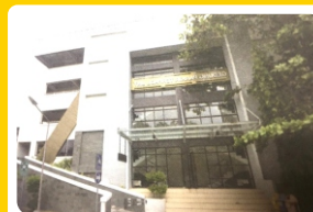
Gedung Parkiran Terpadu