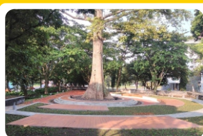
Taman Randu Alas